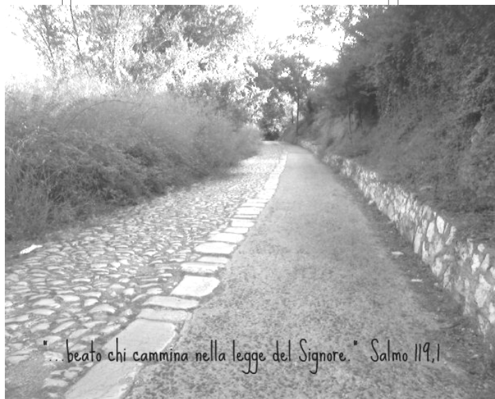
“... beato chi cammina nella legge del Signore.” Salmo 119,1

alla fine dei tempi e ce lo fa vivere come evento di salvezza. Infatti la liturgia so-