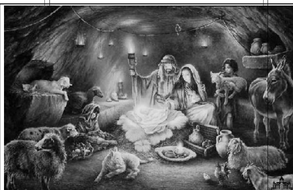
"I pastori andarono dunque senza indugio e trovarono Maria e Giuseppe e il bambino, che giaceva nella mangiatoia." (Lc. 2, 16)

ni di consumo, l'età dei componenti, il tipo di vacanze, il tempo libero... Anche dei